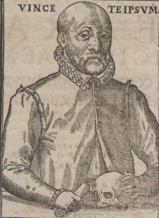
EFFIGIES IOANNIS WIERI ANNO ÆTATIS LX. SALVTIS M.D.LXXVI.

Εἰς Ἰωάννην τὸν Βιῆρον ἰατρόν Γ. Φαλκεπυργίῳ.